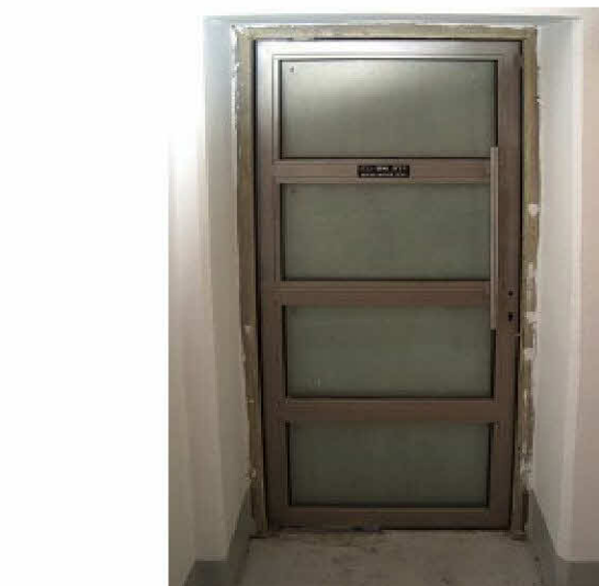
דלת אש זכוכית מחופה שיש