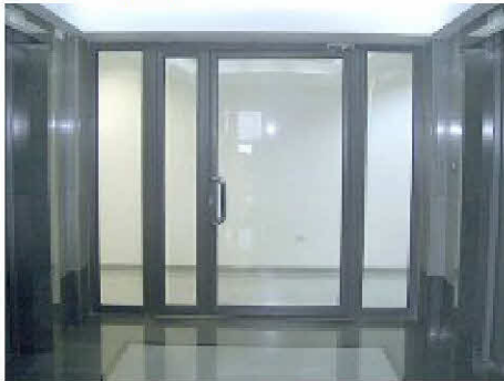
דלת אש ועשן